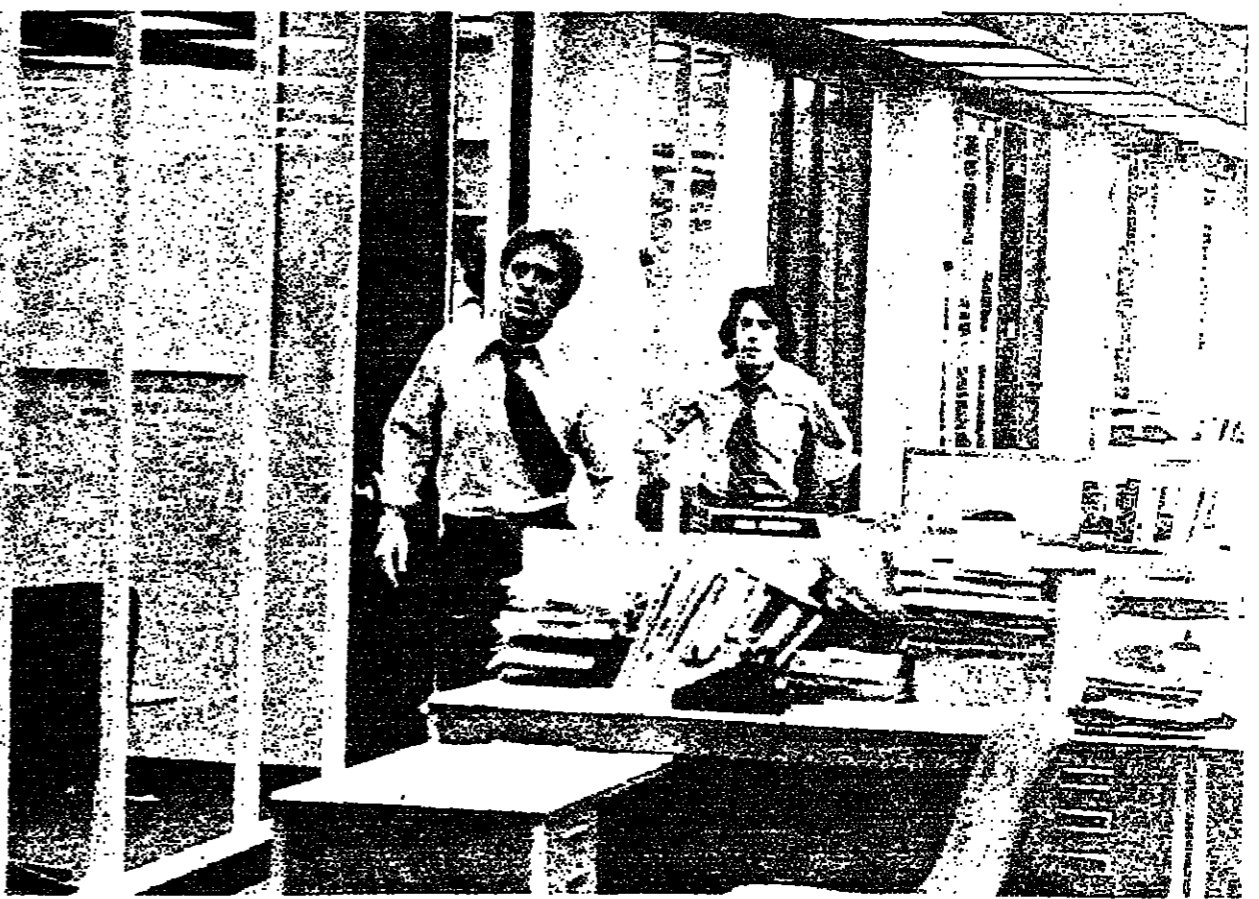
صالة تحرير جريدة واشنطن بوست التي أعيد تصميمها داخل الاستوديوهات لتعطي الصورة الحقيقية عن النظام في الجريدة

ويتخلل الفيلم مشاهد من التلفزيون والرئيس نيكسون يحلف اليمين بعد إعادة انتخابه رئيسا للولايات المتحدة ..